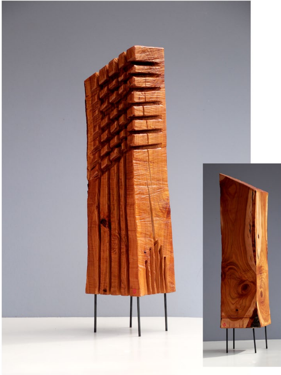
"Innocent House #8978,,; ca.77x18x15; Kirsche, Stahl; 2017