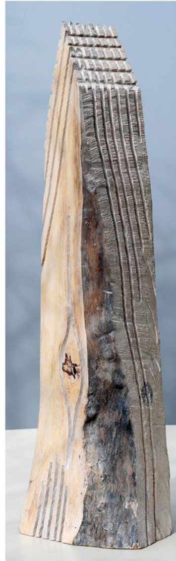
“Innocent Houses #8011; ca.115x28x25; Esche, Öl, Pigmente; 2017