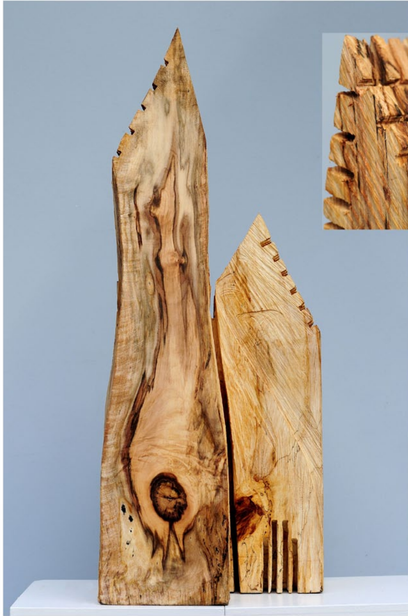
"Innocent Houses #7999; ca.80x34x26; Esche, Öl, Pigmente; 2017