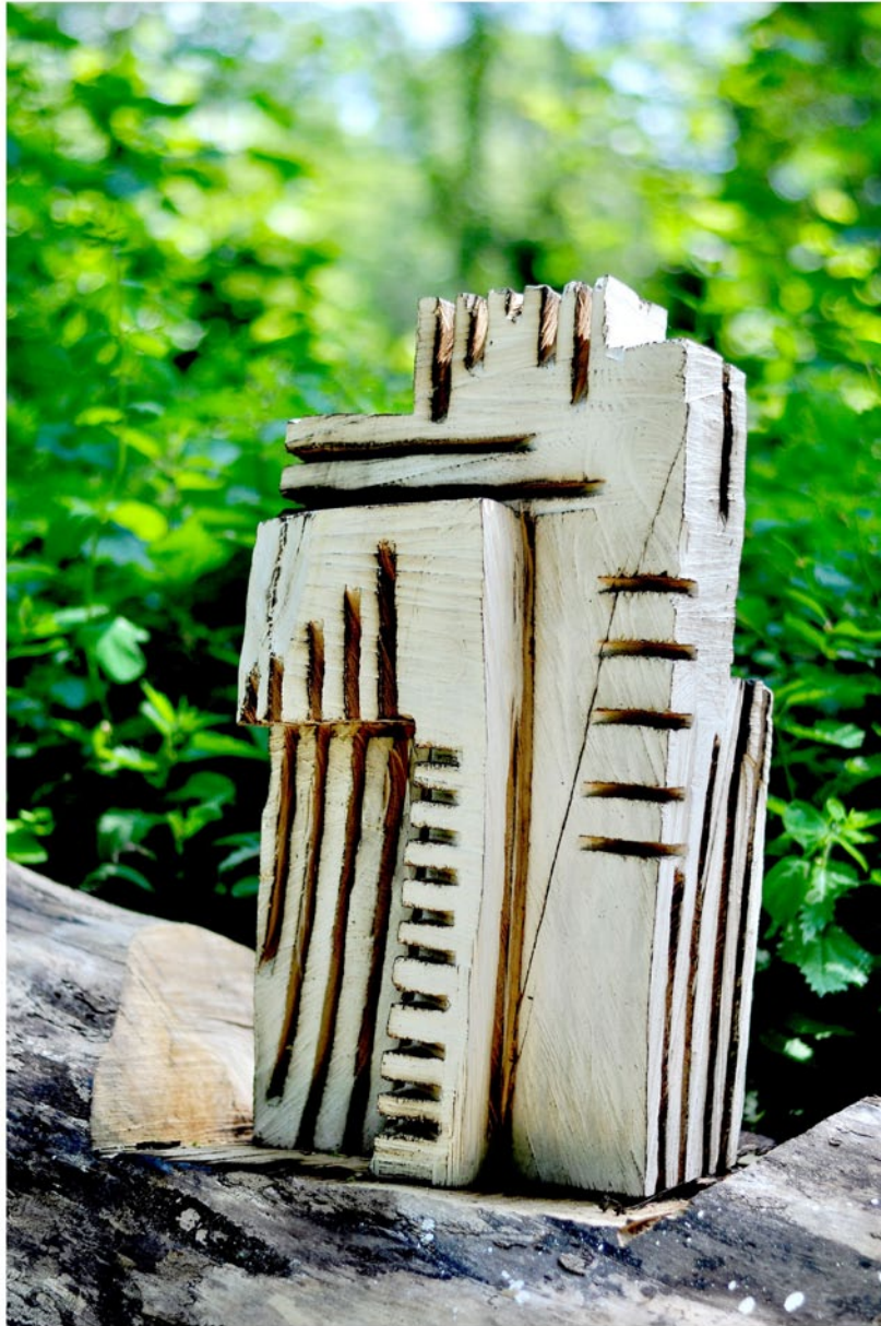
"Innocent Houses #5842; ca.60x30x25; Esche, Lasur, Pigmente; 2017