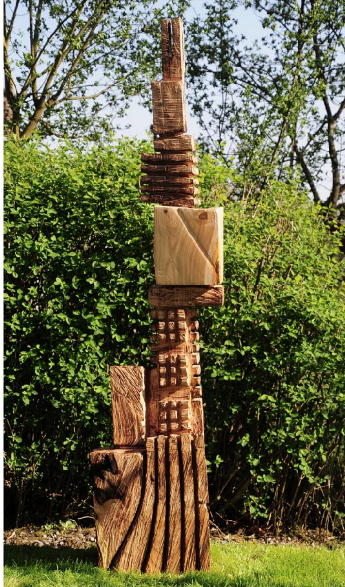
"Innocent House #8505,,"; ca.210x55x40; Kirschholz, geölt; 2017