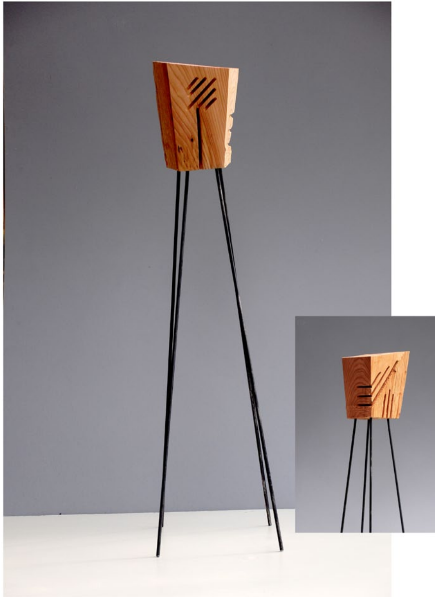
"Innocent House #8966,,"; ca.105x21x18; Lärche, Stahl; 2017