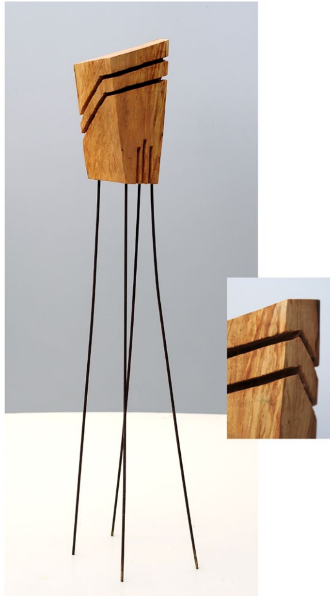
"Innocent Houses #8037; ca.101x18x11; Esche, Öl, Pigmente; 2017