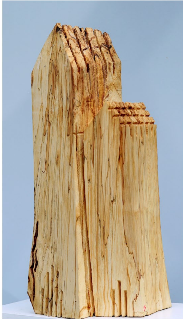
"Innocent Houses #7990; ca.69x34x27; Esche, Öl, Pigmente; 2017