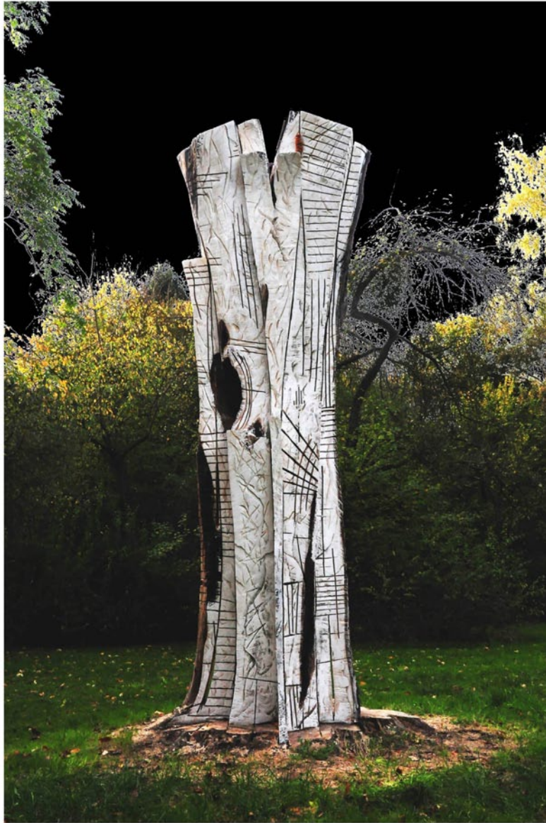
"Innocent House #8973,,,"; ca.420x110x110; Nelson Mandela Park Aachen; Kastanie; 2017