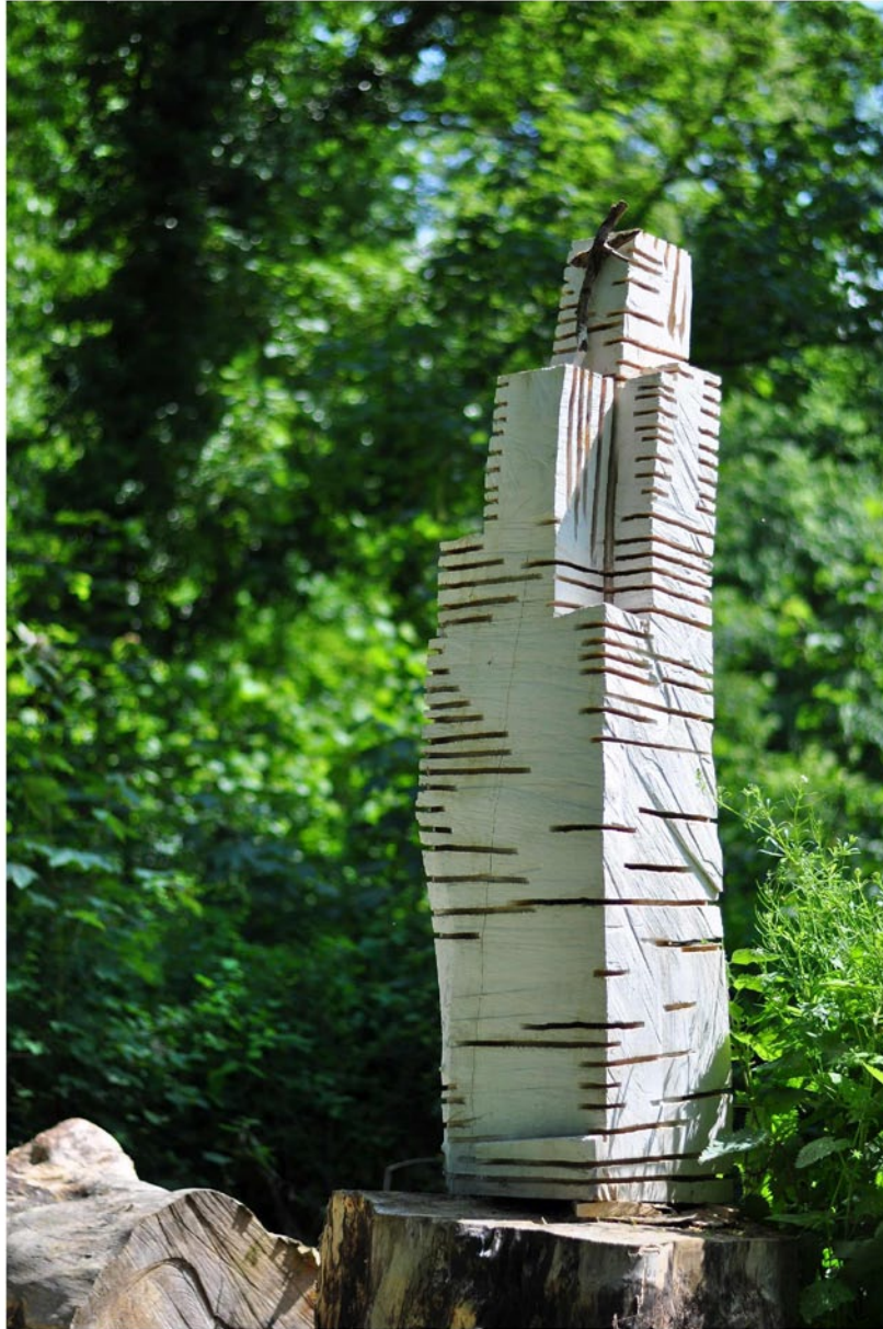
“Innocent House - Home Sweet Home 58.37”; ca.210x55x55; Esche, Acryllasur; 2016