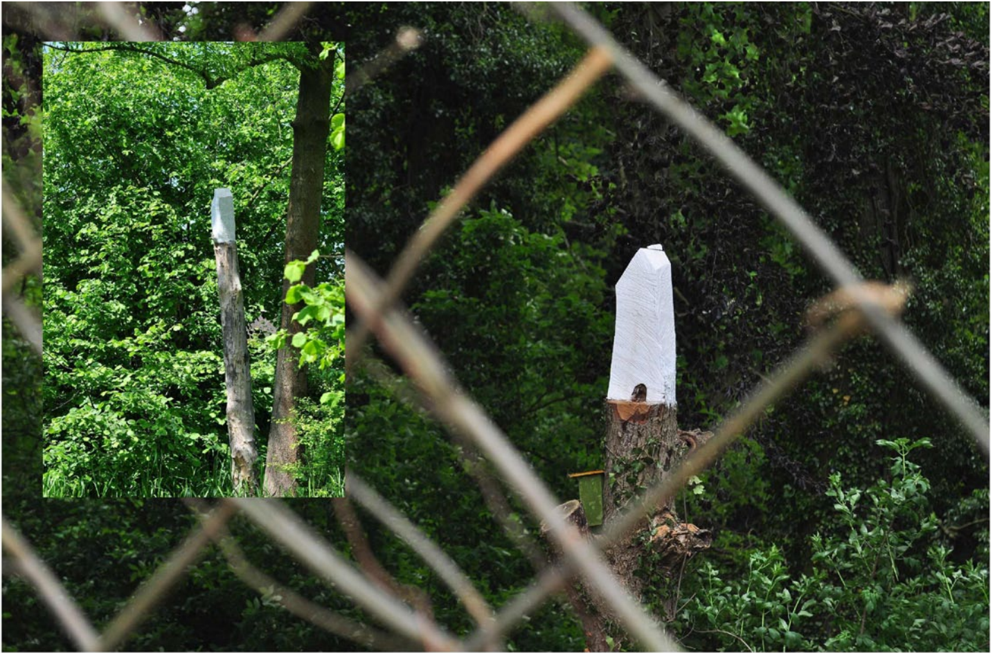
"Innocent House - Home Sweet Home 54.47"; Installation Maastricht 2016