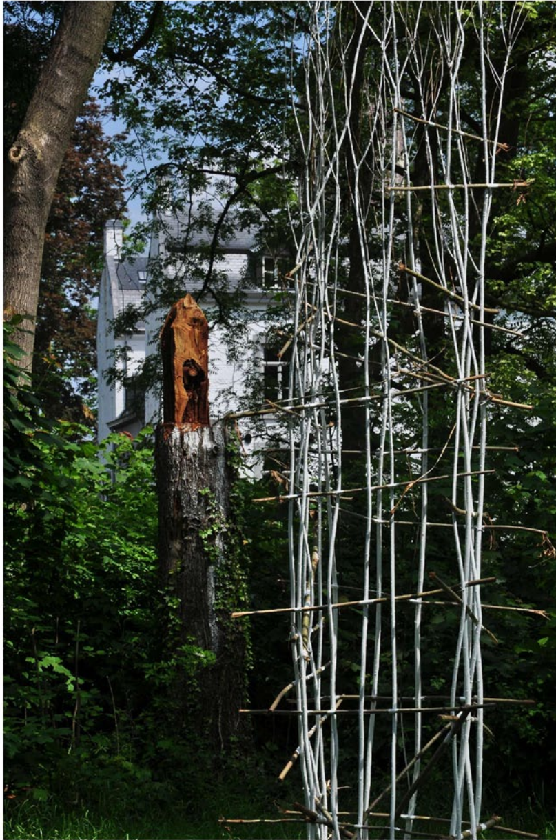
“Innocent House - Home Sweet Home 59.60”; Installation Maastricht 2016