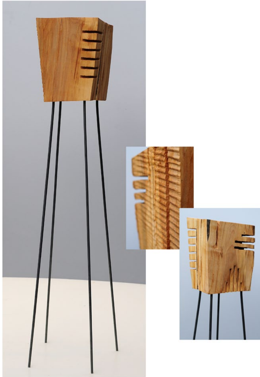
"Innocent Houses #8081; ca.116x23x22; Esche, Öl, Pigmente; 2017