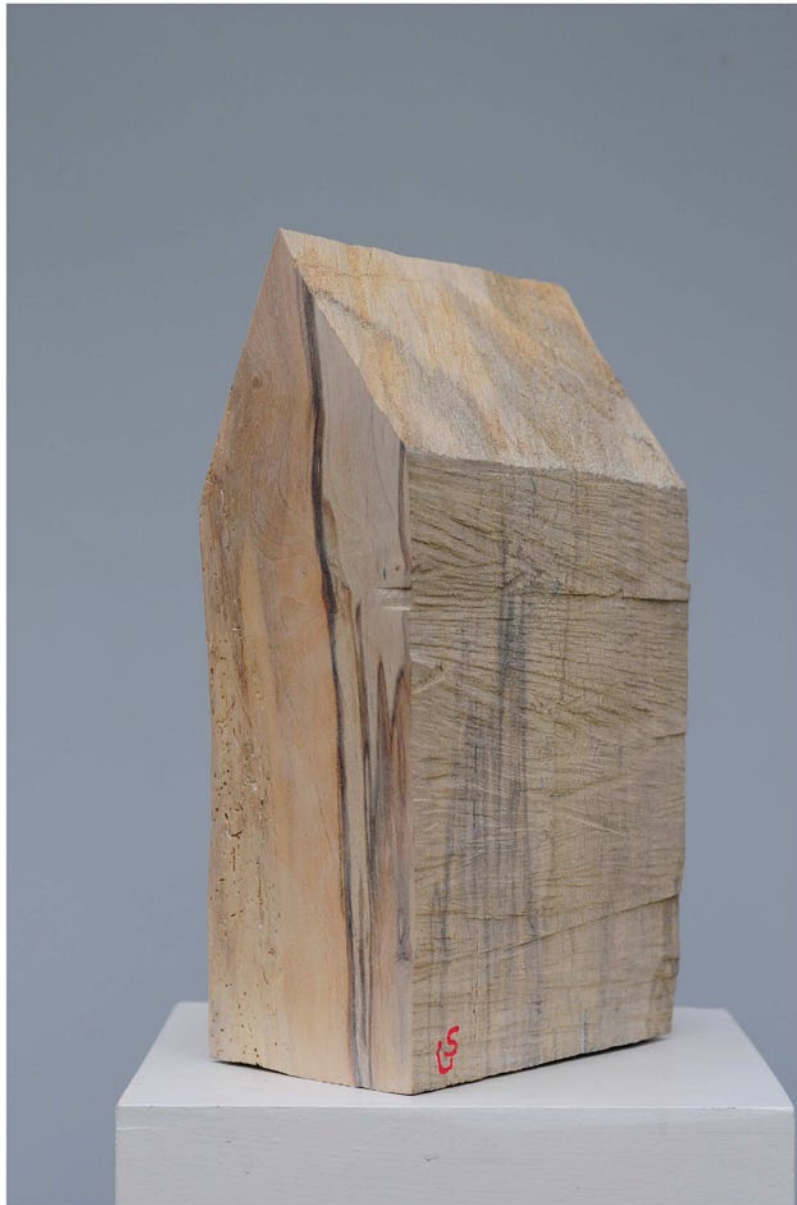
"Innocent Houses #7969; ca.37x12x21; Esche, Öl, Pigmente; 2017