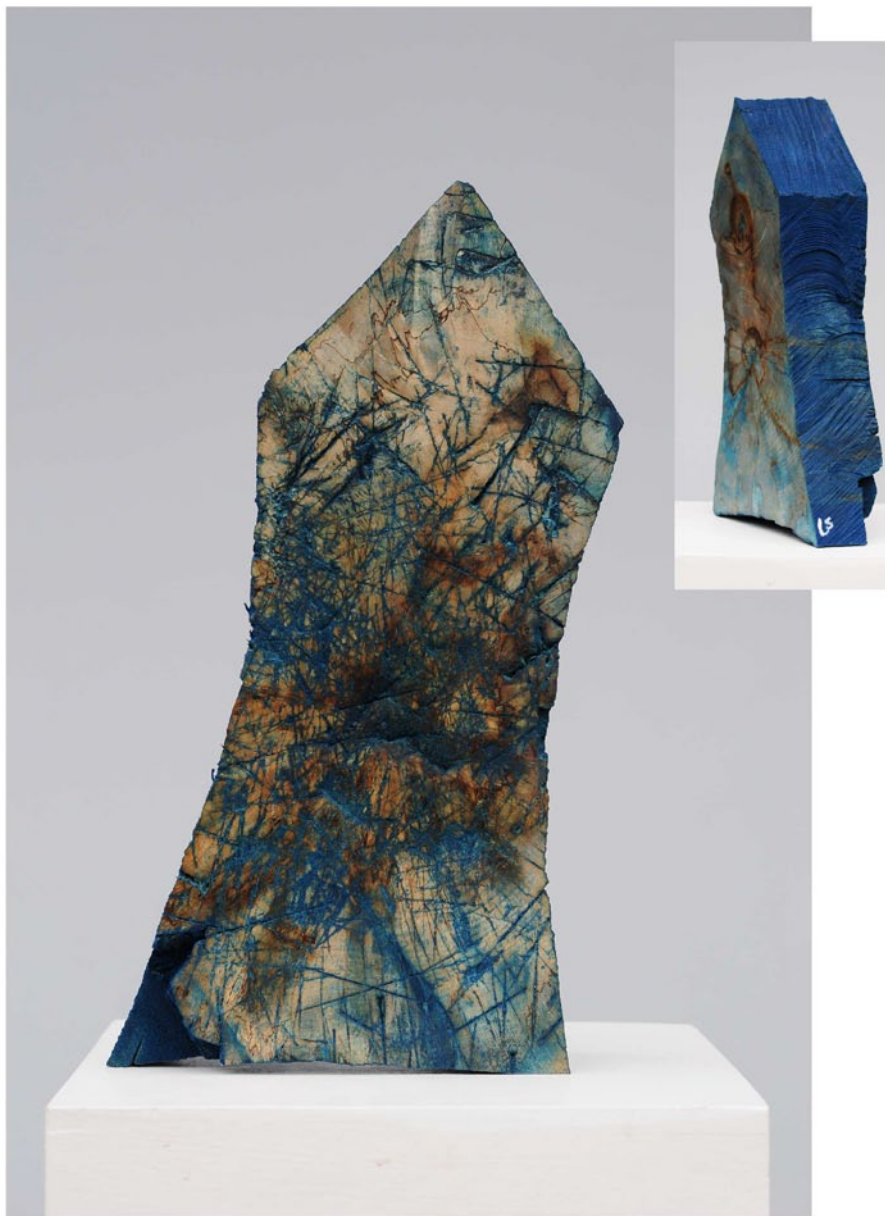
"Innocent Houses #7962; ca.37x21x9; Esche, Öl, Pigmente; 2017