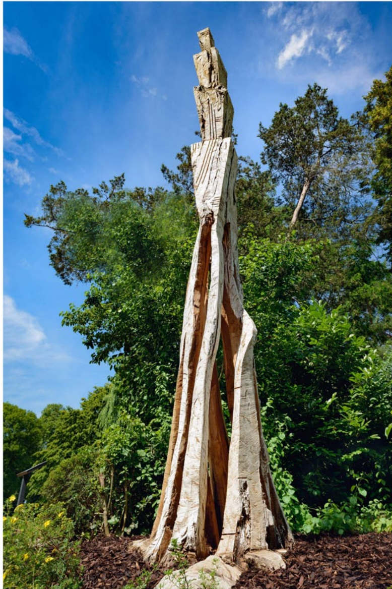
“Innocent House #8993,,; ca.580x90x90; Archiv des LVR - Abtei Brauweiler; Robinie; 2018