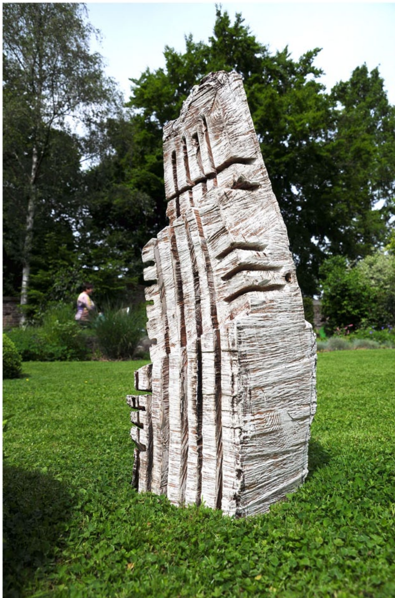
"Innocent House #8653,,; ca.105x32x30; Esche; 2017