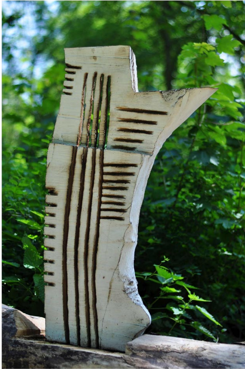
"Innocent House - Home Sweet Home 58.43"; ca.110x55x25; Esche, Acryllasur; 2016