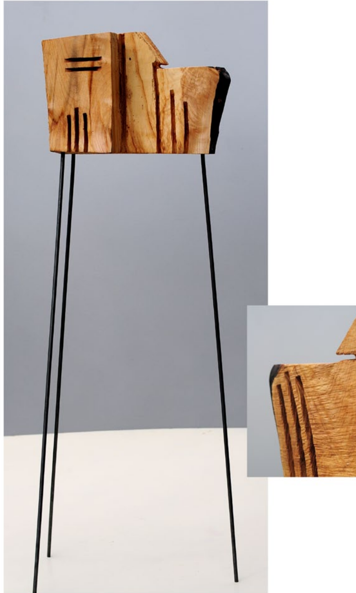
"Innocent Houses #8071; ca.113x28x21; Esche, Öl, Pigmente; 2017