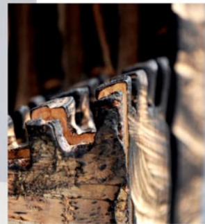
“Innocent House #8989,,; ca.86x25x18; Birke, Stahl; 2017