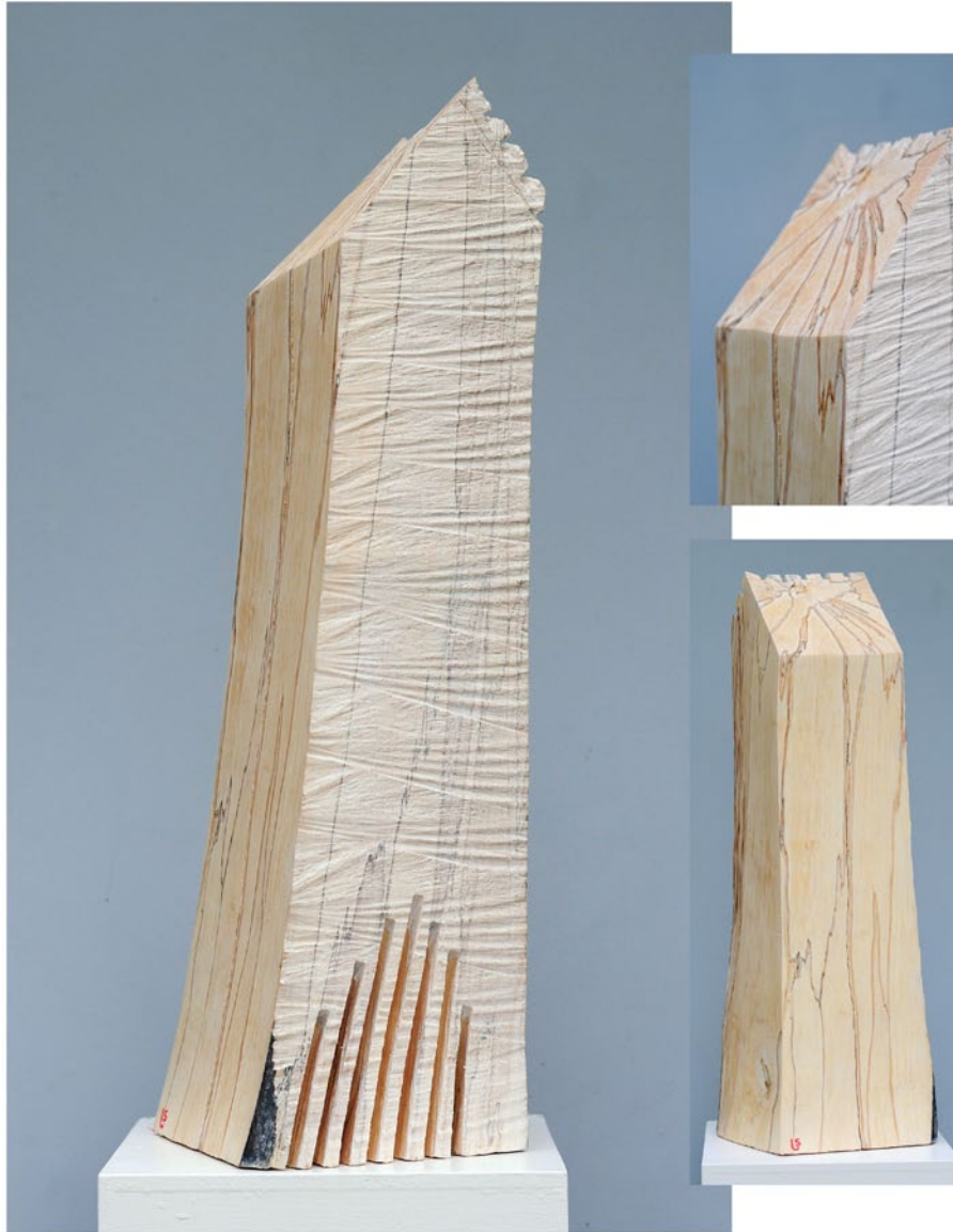
"Innocent Houses #7976; ca.69x20x18; Esche, Öl, Pigmente; 2017