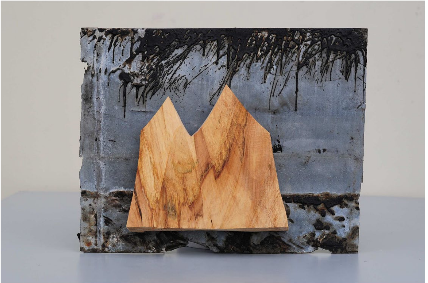
“Innocent Houses #7957; ca.45x35x5; Esche, Öl, Zink, Bitumen; 2017