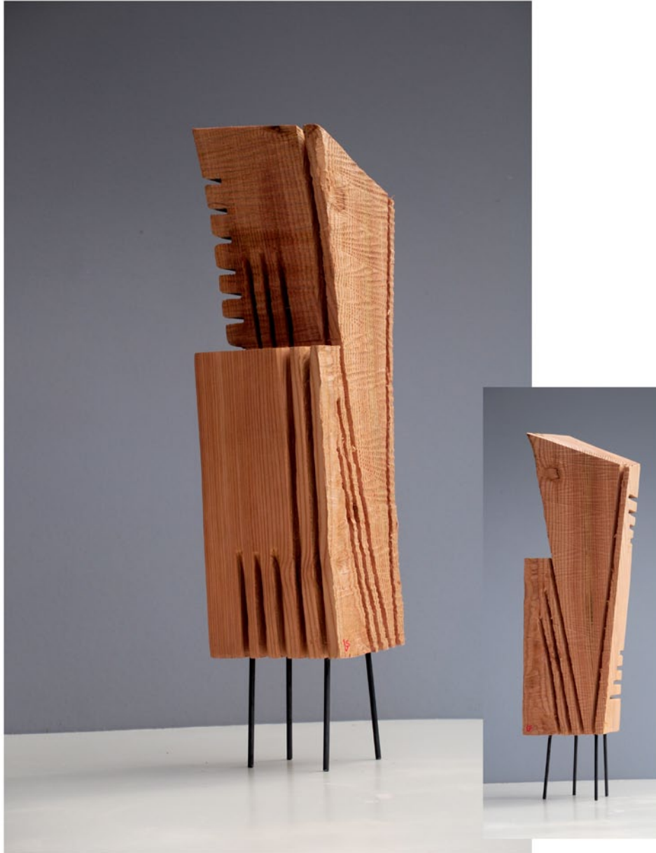
"Innocent House #8980,,"; ca.68x25x15; Lärche, Stahl; 2017