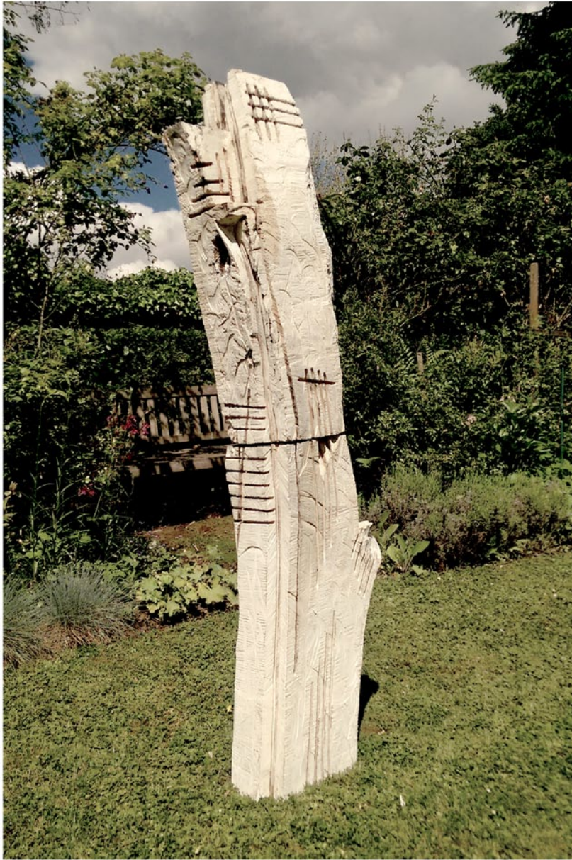
"Innocent House #8104,,,"; ca.200x40x30; Esche, Farbe, Feuer; 2017