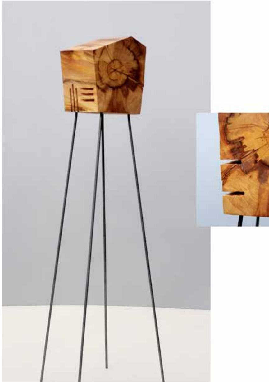
"Innocent Houses #8025; ca.113x22x17; Esche, Öl, Pigmente; 2017