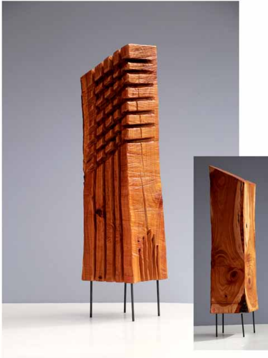
"Innocent House #8978,,; ca.77x18x15; Kirsche, Stahl; 2017