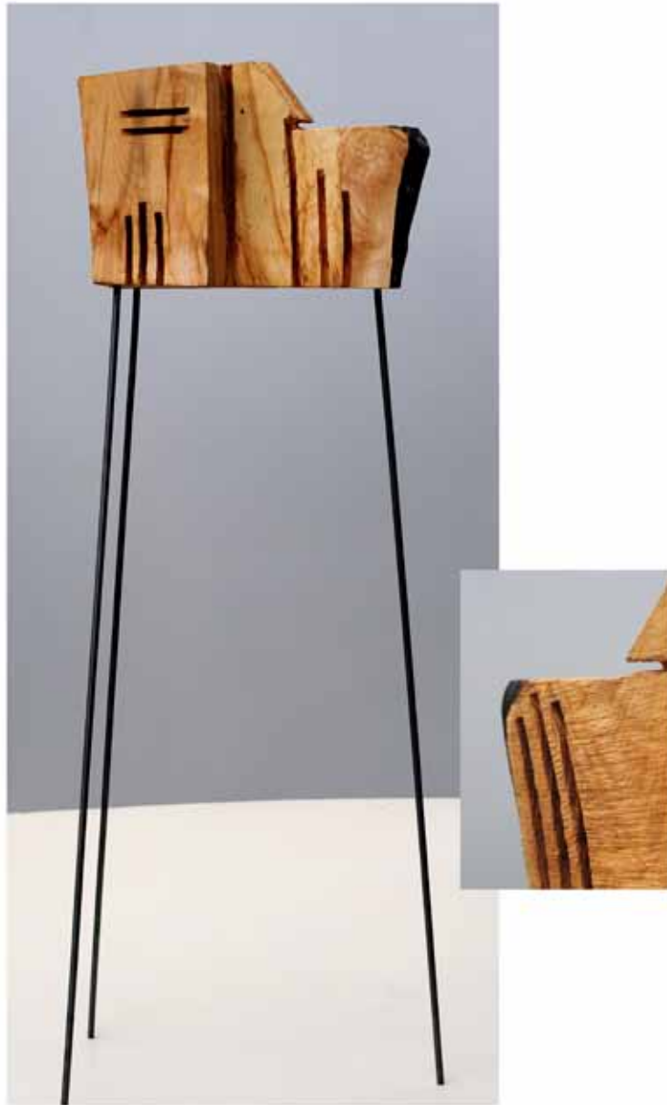
"Innocent Houses #8071; ca.113x28x21; Esche, Öl, Pigmente; 2017