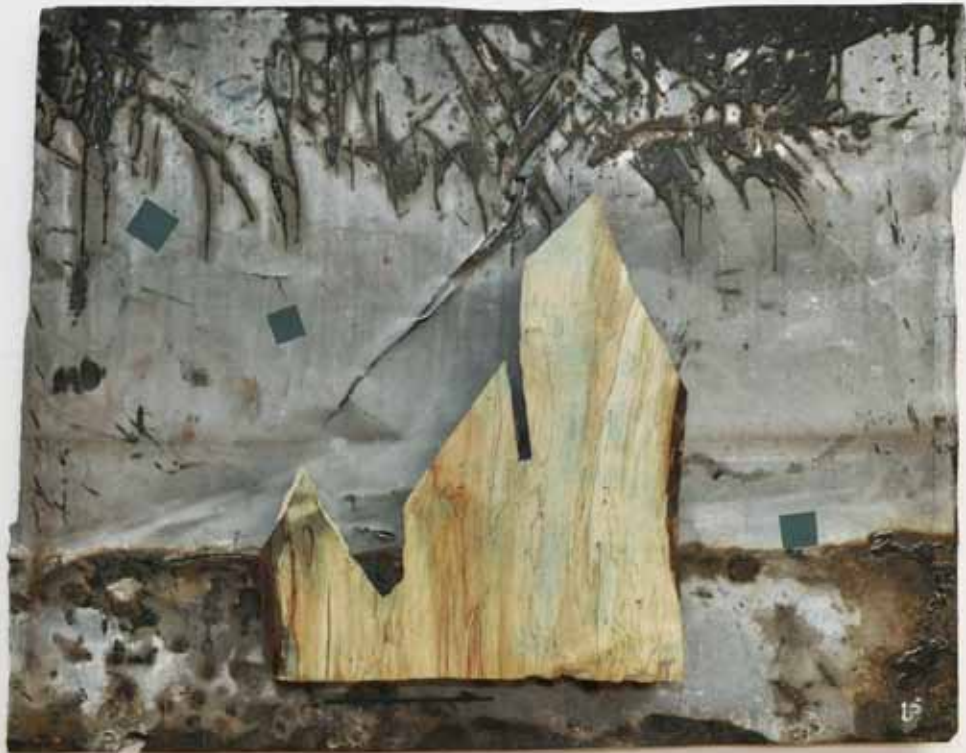
"Innocent Houses #7963; ca.51x40x5; Esche, Öl, Acrylfarbe, Pigmente; 2017"