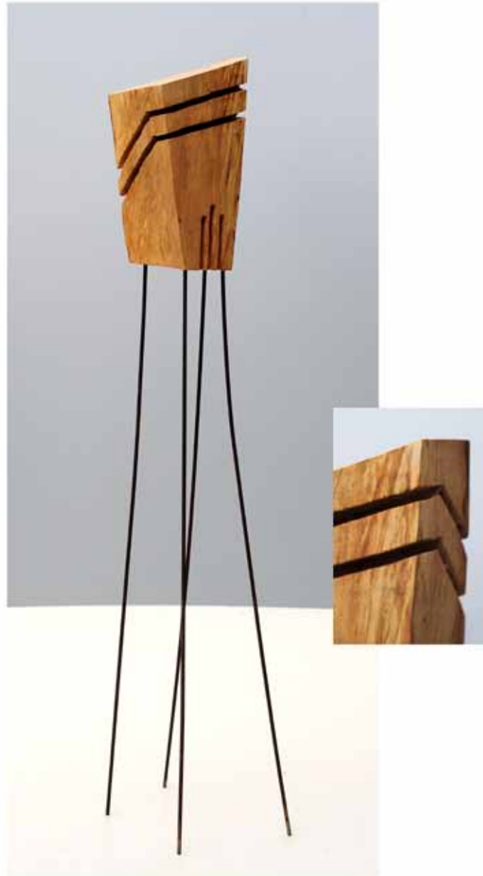
"Innocent Houses #8037; ca.101x18x11; Esche, Öl, Pigmente; 2017