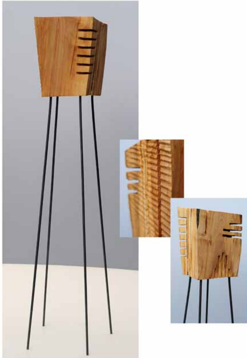
"Innocent Houses #8081; ca.116x23x22; Esche, Öl, Pigmente; 2017