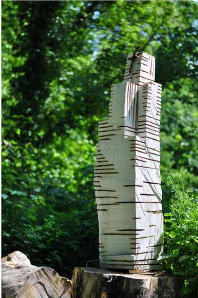
"Innocent House - Home Sweet Home 58.37"; ca.210x55x55; Esche, Acryllasur; 2016