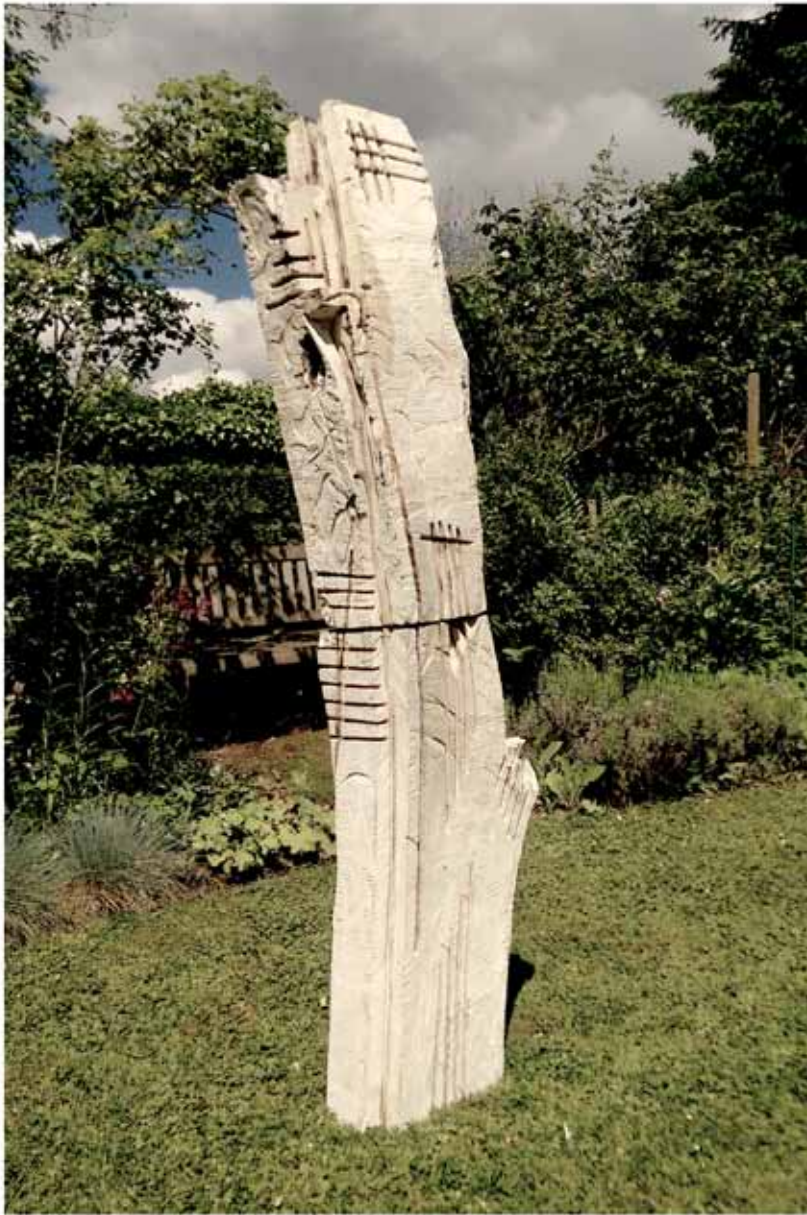
"Innocent House #8104,,; ca.200x40x30; Esche, Farbe, Feuer; 2017