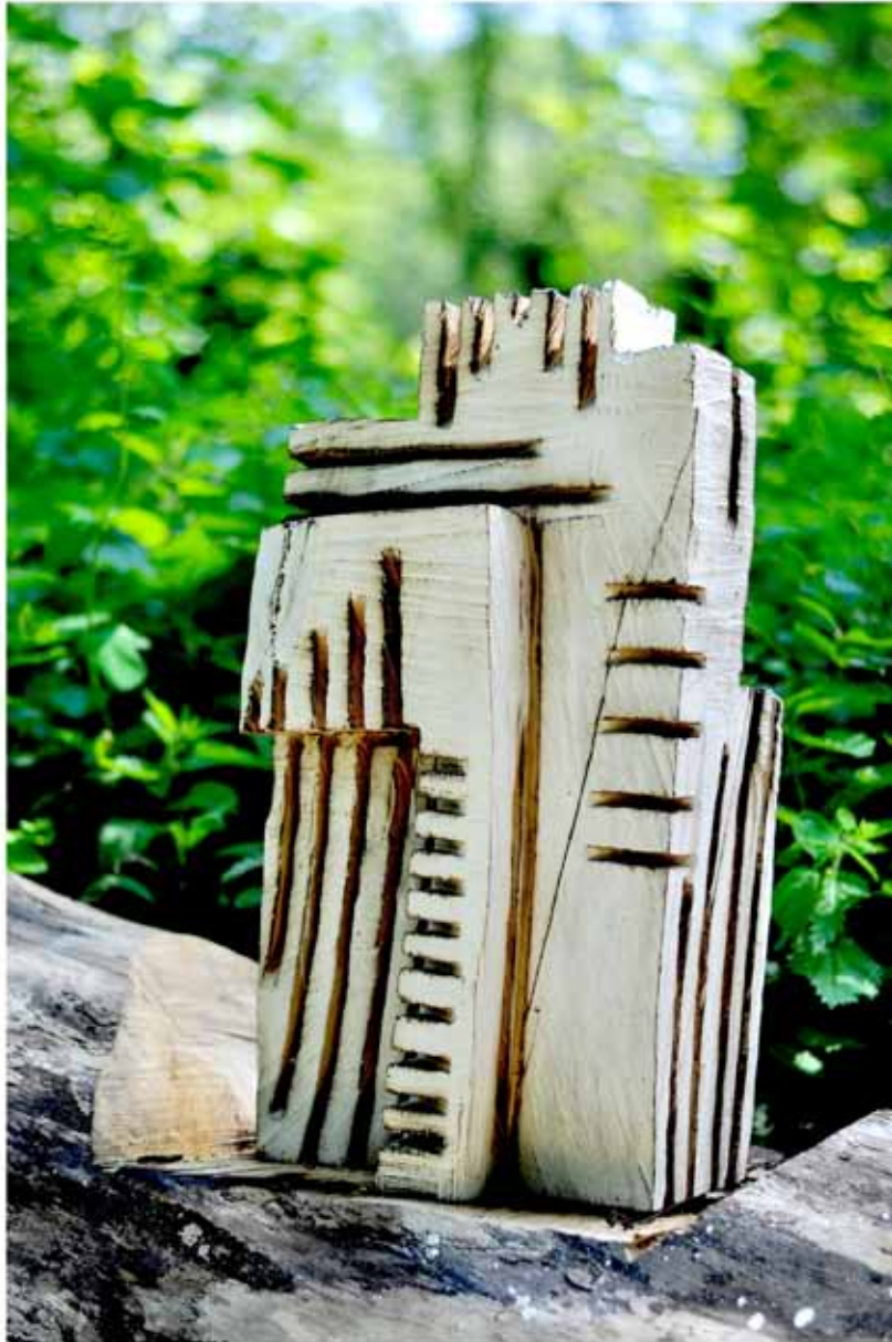
"Innocent Houses #5842; ca.60x30x25; Esche, Lasur, Pigmente; 2017