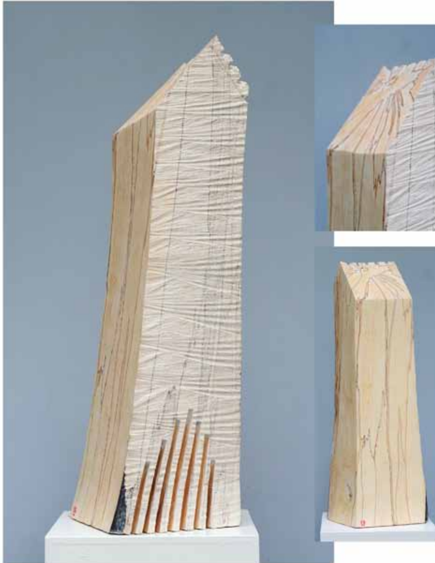
"Innocent Houses #7976; ca.69x20x18; Esche, Öl, Pigmente; 2017