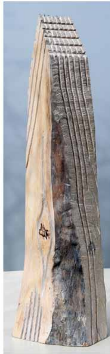
"Innocent Houses #8011; ca.115x28x25; Esche, Öl, Pigmente; 2017