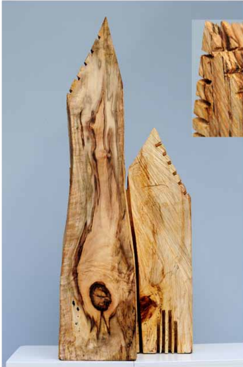
"Innocent Houses #7999; ca.80x34x26; Esche, Öl, Pigmente; 2017