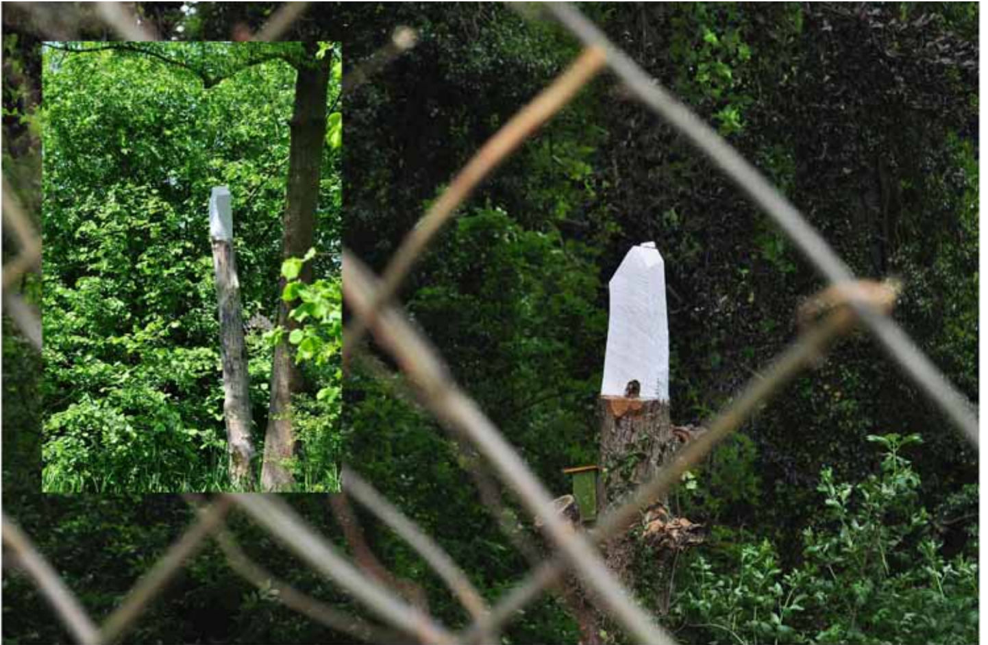
"Innocent House - Home Sweet Home 54.47"; Installation Maastricht 2016