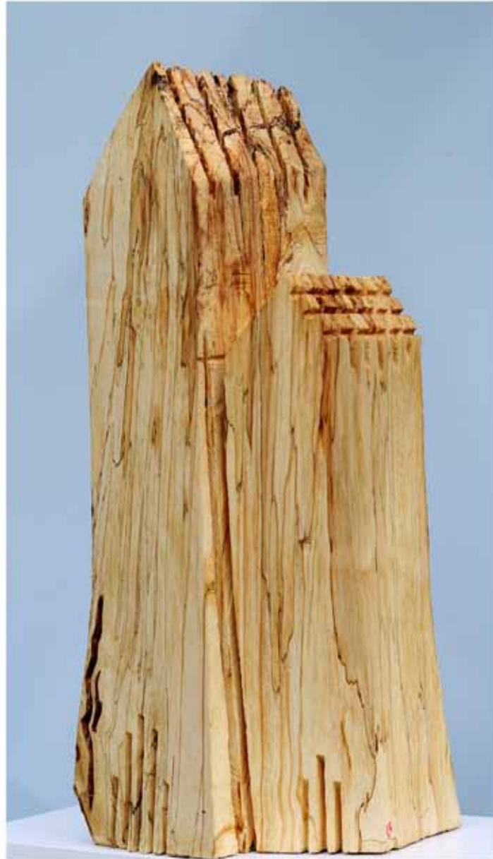
"Innocent Houses #7990; ca.69x34x27; Esche, Öl, Pigmente; 2017