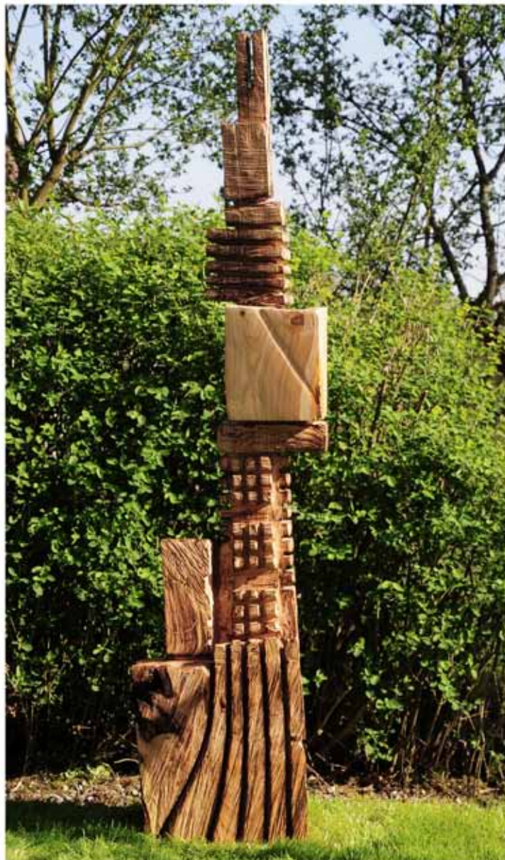
"Innocent House #8505,."; ca.210x55x40; Kirschholz, geölt; 2017