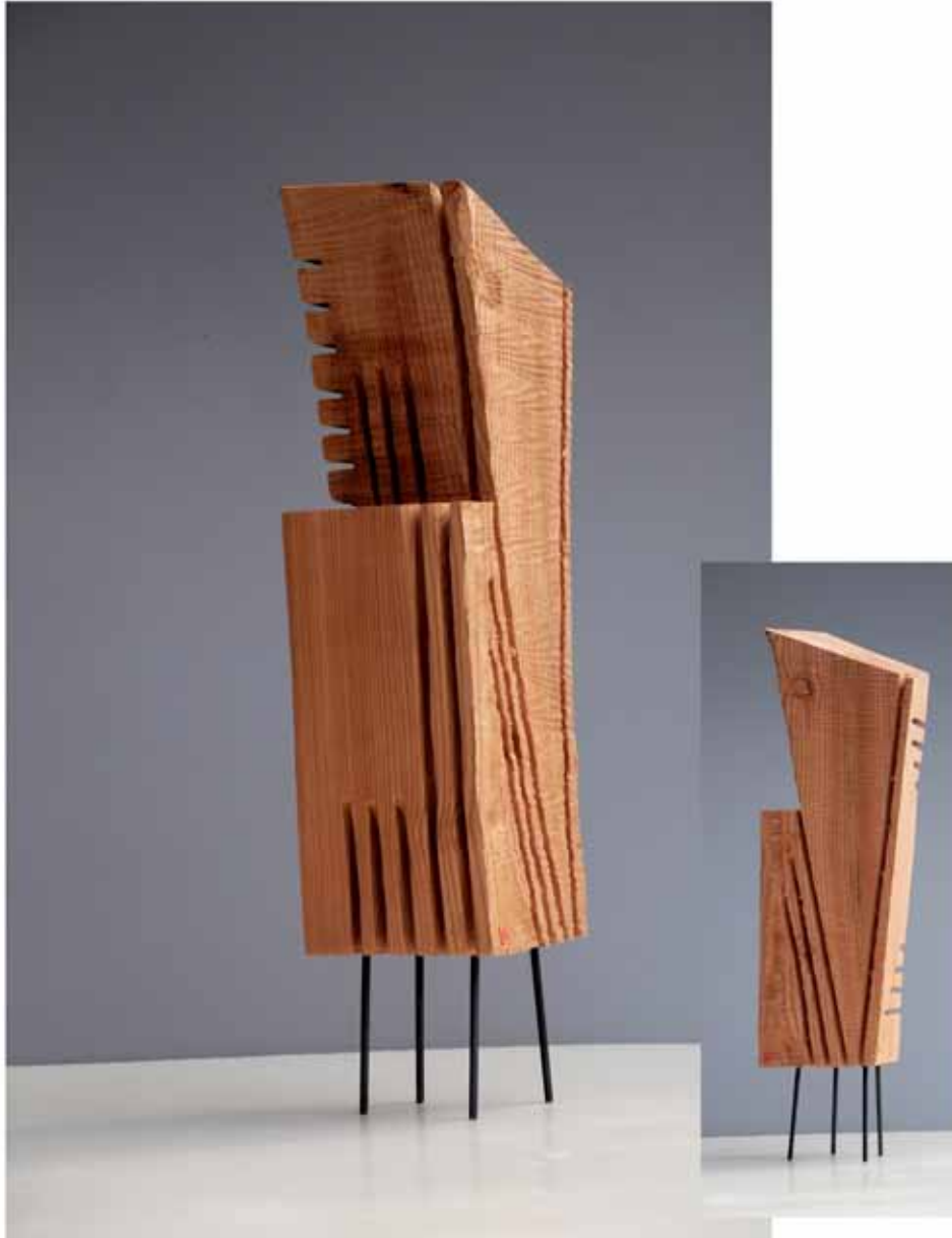
"Innocent House #8980,,"; ca.68x25x15; Lärche, Stahl; 2017