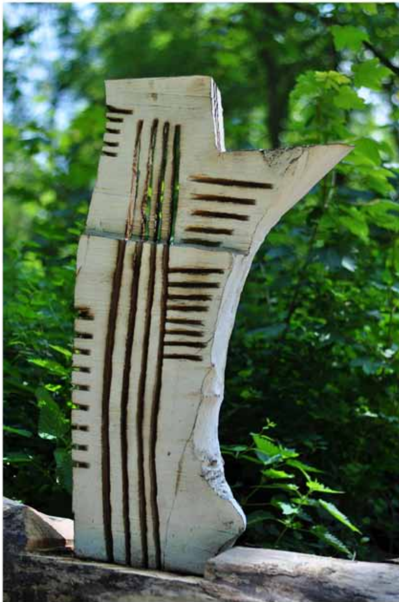
"Innocent House - Home Sweet Home 58.43"; ca.110x55x25; Esche, Acryllasur; 2016