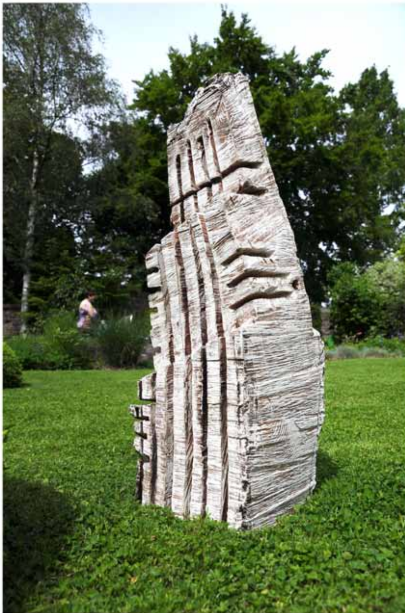
"Innocent House #8653,,; ca.105x32x30; Esche; 2017