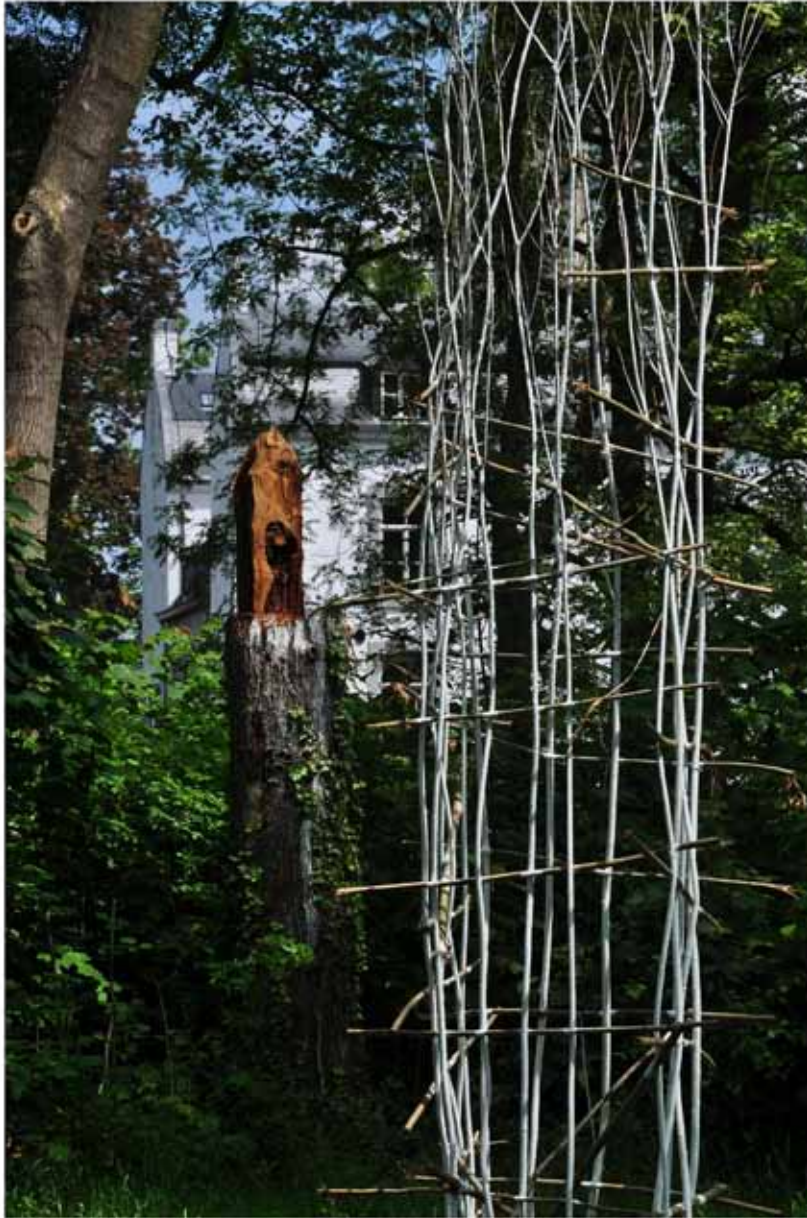
"Innocent House - Home Sweet Home 59.60"; Installation Maastricht 2016