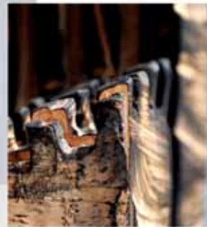
"Innocent House #8989,,; ca.86x25x18; Birke, Stahl; 2017