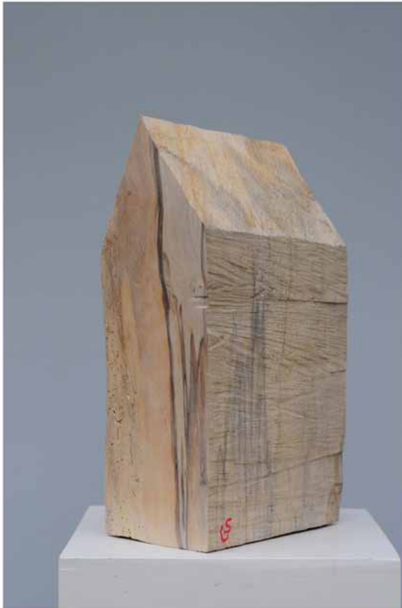
"Innocent Houses #7969; ca.37x12x21; Esche, Öl, Pigmente; 2017