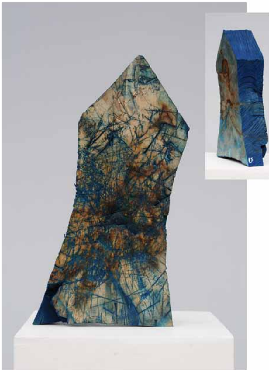
"Innocent Houses #7962; ca.37x21x9; Esche, Öl, Pigmente; 2017