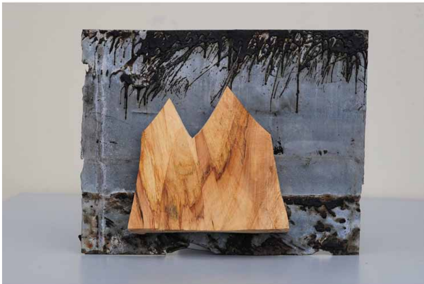
"Innocent Houses #7957; ca.45x35x5; Esche, Öl, Zink, Bitumen; 2017