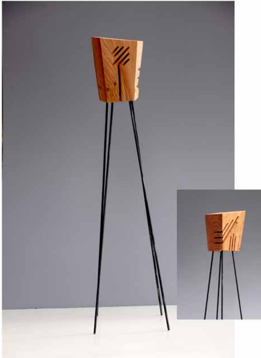
"Innocent House #8966,,"; ca.105x21x18; Lärche, Stahl; 2017